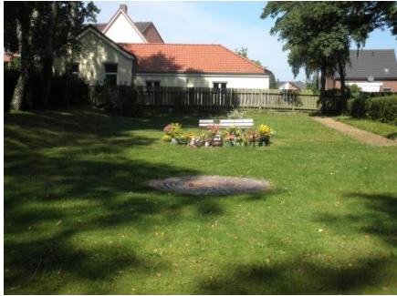
Urnenfeld mit Lebensspirale

Diese Form der Beisetzung sollte erst nach reiflicher Überlegung gewählt werden. Oft zeigt sich erst später, wie wichtig eine individuelle Grabstätte als persönlicher Anlaufpunkt bei der Trauerbewältigung ist.