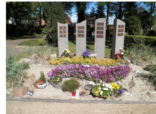
Beispiel für ein Urnengemeinschaftsgrab

bieten Platz für 24 Urnen. Die Grabstätten werden gärtnerisch angelegt und gepflegt, jede(r) Verstorbene wird auf dem gemeinsamen Grabmal genannt. Eine Platzreservierung ist nicht möglich.