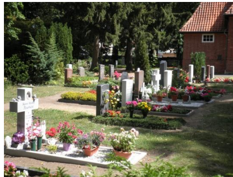
Wahlgrabstätten für Erdbeisetzungen

Auf jeder Grabstätte für Sargbeisetzungen können auf Wunsch bis zu zwei Urnen zusätzlich beigesetzt werden.