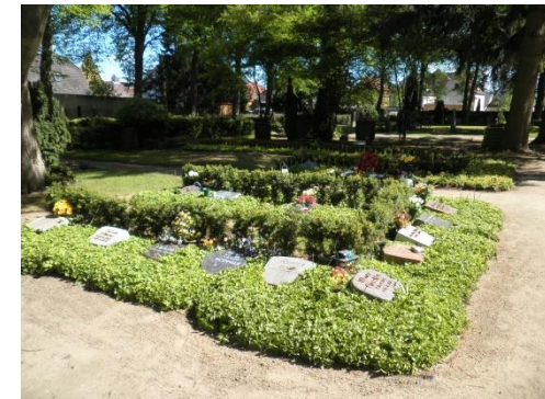
bepflanzte Grabstätten für Urnenbeisetzungen

werden im Auftrag des Friedhofes mit einem Bodendecker bepflanzt und gepflegt. Ein liegendes Grabmal bis 40x40 cm ist erlaubt, ebenso ein kleiner Pflanzkasten als Blumenschmuck.